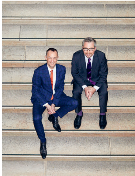
S. 32 | Von Porzellanbergen, Nashörnern und Esslaboren: Was leisten gute Museen?